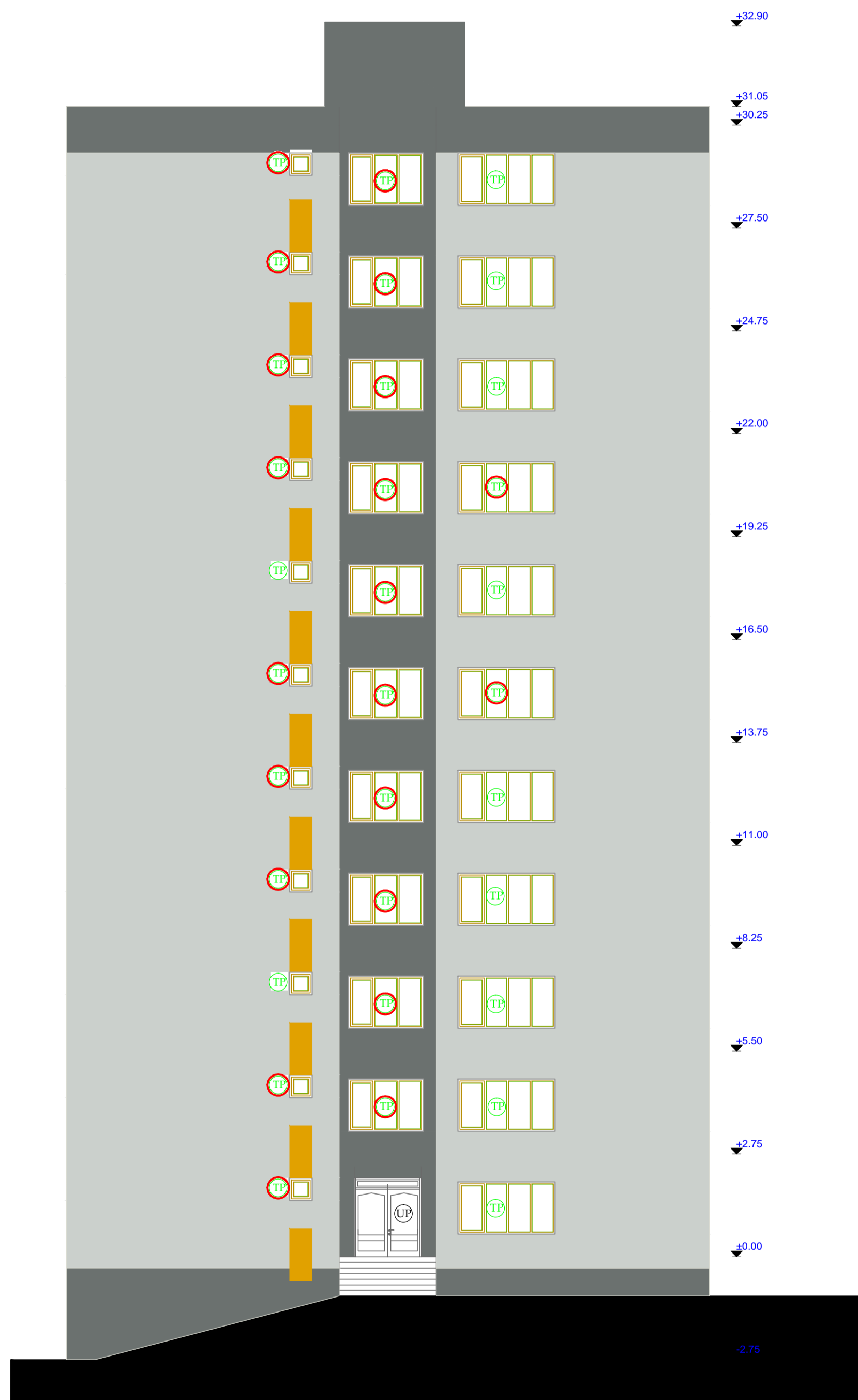
FATADA LATERAL STANGA propus Scara 1:100